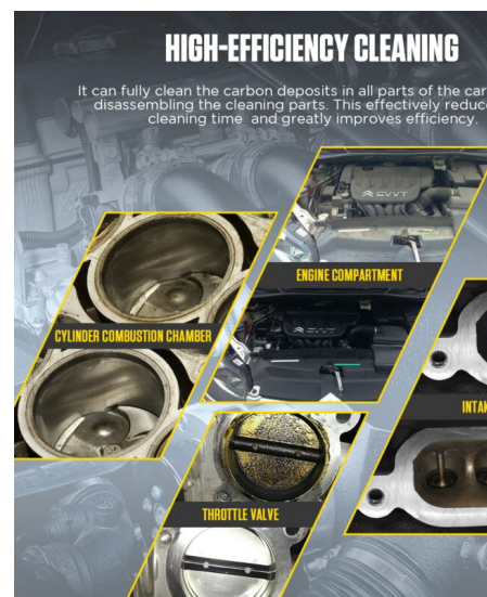
Skuteczność dekarbonizacji: Komora spalania, zawory, przepustnica.