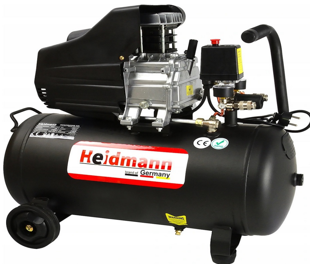
KOMPRESOR OLEJOWY SPRĘŻARKA 50L 8bar HEIDMANN H00721

Jeden z najmocniejszych kompresorów 50 litrowych dostępnych na rynku !