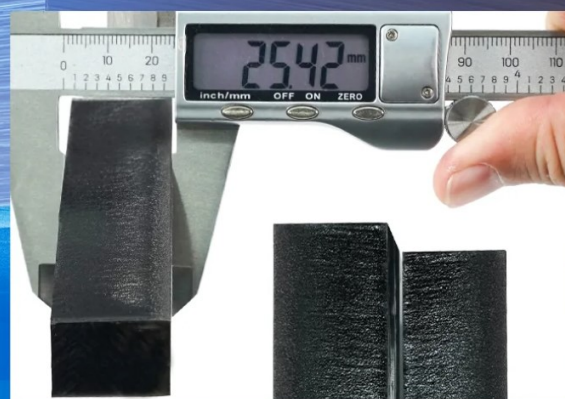
25mm Acrylic, Cut once