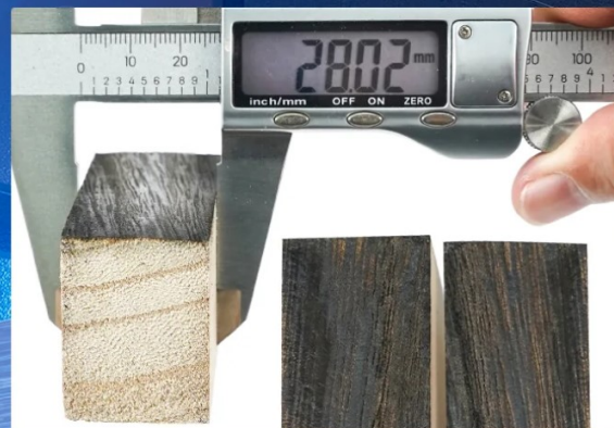
28mm Paulownia, Cut once